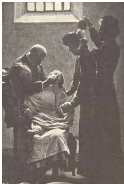
האכלה כפויה של סופרג'יסטיות בכלא בריטי, 1911

אסירים הצמים במחאה כנגד הרשויות או כדי לדרוש מהן משהו נמצאים בסיטואציה כפויה שאין בה מקום רב למחאה. רוב בתי הכלא מאפשרים מרחב קטן בלבד לתלונות או התנגדות, כך שצום נתפס כצורת המחאה היחידה הפתוחה בפני האסירים. דבר זה נכון במיוחד עבור אסירים פוליטיים. שביתת רעב נחשבת כצורת מחאה לא אלימה. האיום באלימות מכוון כנגד השובת עצמו, ולא ישירות כנגד הרשויות. בהיסטוריה הבריטית למשל שבתו הסופרג'יסטיות שביתת רעב, להשגת שוויון זכויות לנשים. גאנדי שבת רעב בהודו זכה להערכה רבה, האירים ב־1980 שבתו רעב עד מוות.