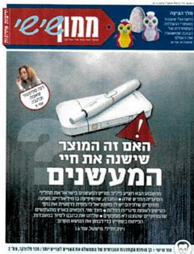
"פוטנציאל להפחית דרמטית את נזקי העישון". שער "ממון", 16.12.16

חברות הסיגריות הגדולות הוציאו בעשור האחרון קרוב לחצי מיליארד שקל על פרסום ושיווק של מוצרי טבק בישראל – כך על-פי נתונים שהחוק מחייב אותן למסור למשרד הבריאות מדי שנה. בשנים האחרונות, עם התפתחות הרשתות החברתיות, מפנות החברות כספים רבים לפרסום בפייסבוק – שעליו קשה עד בלתי אפשרי לפקח.