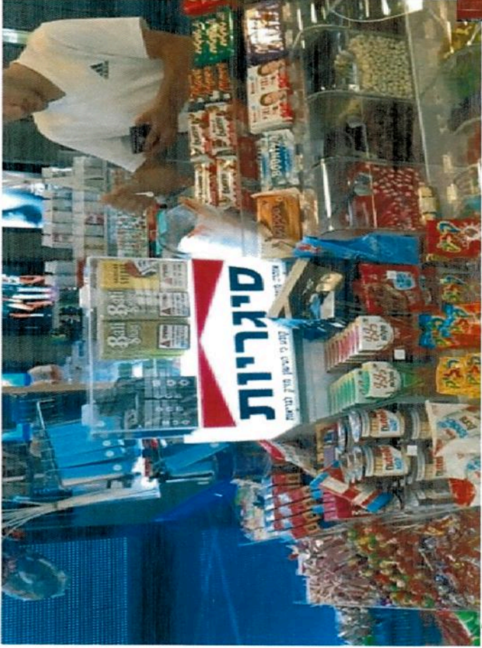
נקודת מכירה בישראל