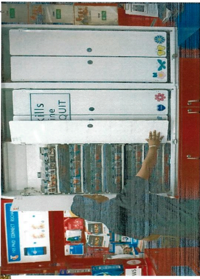
נקודת מכירה באוסטרליה